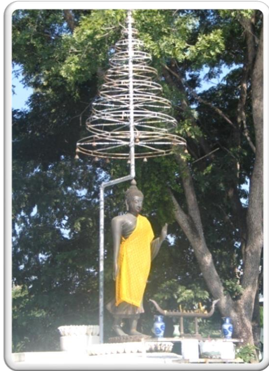
พระพุทธรูปตามหามุณี ไพร่พินาศ ประสาธน์สันตสุขสวัสดิ์ ชินสีห์ธรรมโลกนาถ